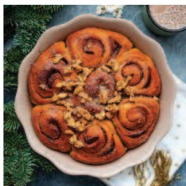
Булочки с корицей