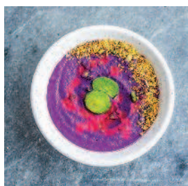
Крем-суп из фиолетовой капусты