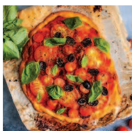
Соус для пиццы