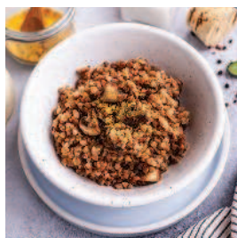
Гречотто с грибами