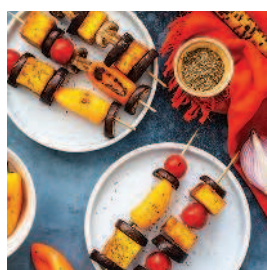
Шашлычки из тофу