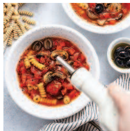
Суп со вкусом лазаньи