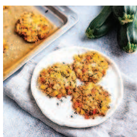
Бургеры из киноа